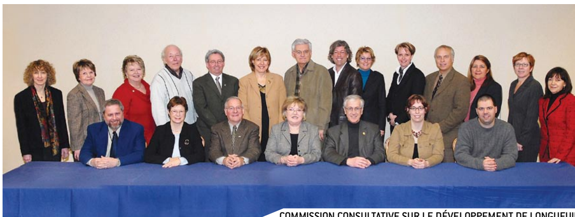
COMMISSION CONSULTATIVE SUR LE DÉVELOPPEMENT DE LONGUEUIL

Le principal mandat de la Commission consultative sur le développement de Longueuil est d'agir à titre d'interlocuteur privilégié de la CRÉ de Longueuil sur toute question de développement régional. Elle pourra être consultée par le conseil d'administration ou le comité exécutif de la CRÉ de Longueuil sur toutes questions à propos desquelles il leur plaira de requérir des avis spécifiques ou ponctuels. Rappelons qu'au cours de l'année 2006-2007, la Commission a agi à titre de comité consultatif dans le cadre de l'élaboration du Plan quinquennal de développement régional 2007-2012 de la CRÉ de Longueuil.