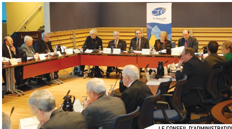
LE CONSEIL D'ADMINISTRATION