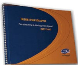
Plan quinquennal de développement régional 2007-2012

Par la suite, la CRÉ de Longueuil a confié à la Commission consultative sur le développement de Longueuil le mandat de revoir une ébauche préliminaire du Plan quinquennal dans le but précis d'obtenir les commentaires et suggestions des différentes sous-commissions sectorielles sur l'ensemble du plan et de déterminer quelles actions concrètes pourraient être entreprises de façon concertée en appui aux orientations proposées. Le Plan quinquennal reflète les commentaires et précisions apportés par les membres des 17 sous-commissions sectorielles et les consensus dégagés lors d'une réunion de la Commission consultative sur le développement de Longueuil le 5 février 2007. Cette rencontre constituait la dernière étape de consultation du milieu.